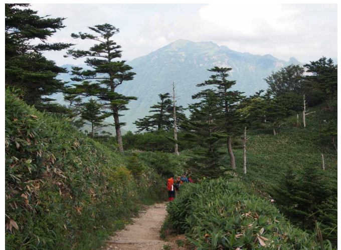
▲ 瓶ヶ森を眺めながら下山

いつもの石鎚山を違うコースから登ろう！と言う事で決まった東稜コース。笹で覆われた登山道と急な岩場ありでスリル万点で楽しめました♪